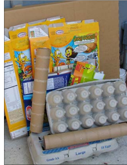
Cartón y bolsas de papel café.

fotos, papel de carbón, aluminio, papel encerado, cartón encerado, envolturas de elementos o goma de mascar, tollas de papel, pañales, elementos o trozos de espuma plástica, aceite de motor, chatarra de metales, clips para papeles o bandas elásticas.